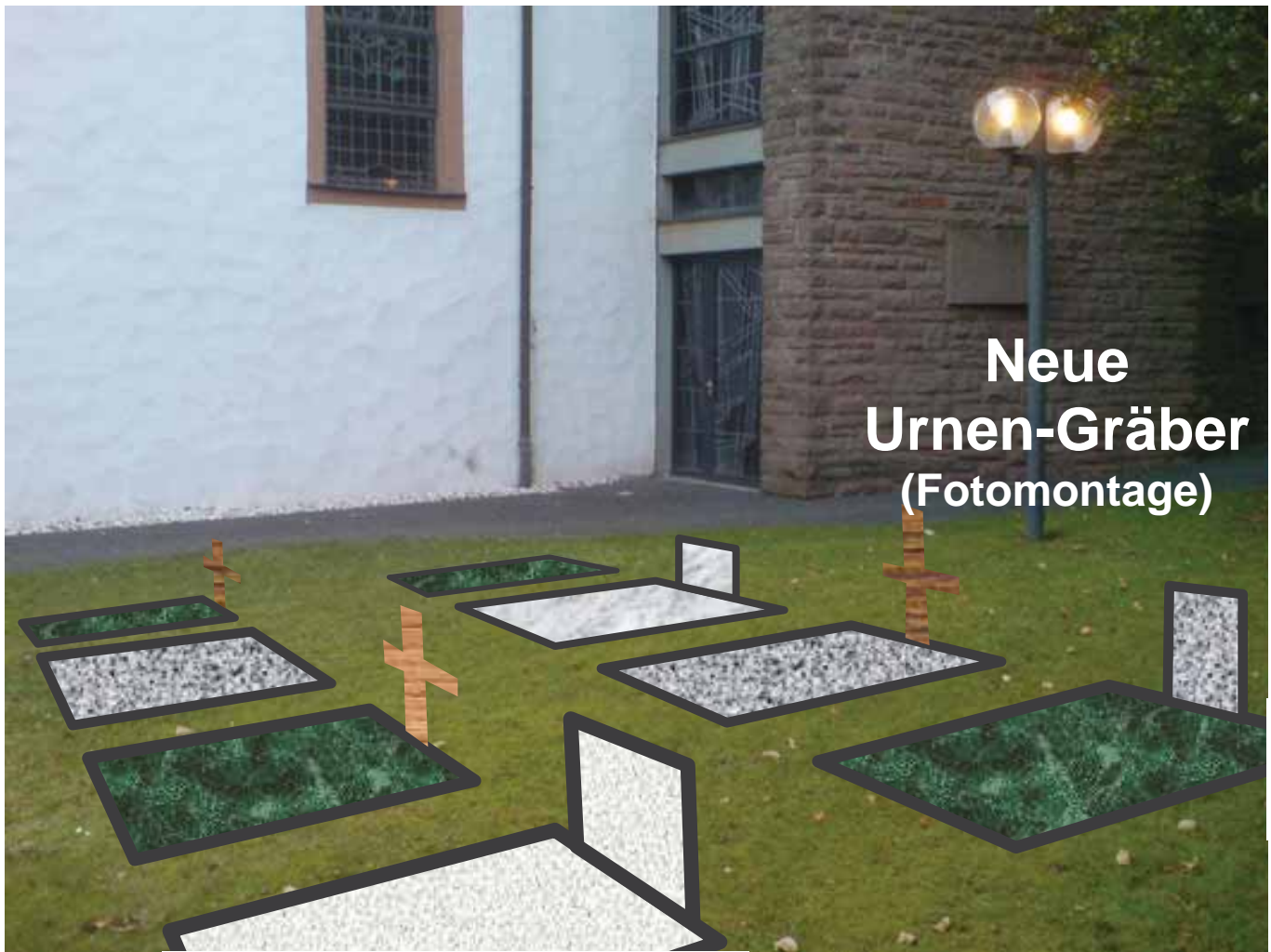
Neue Urnen-Gräber (Fotomontage)